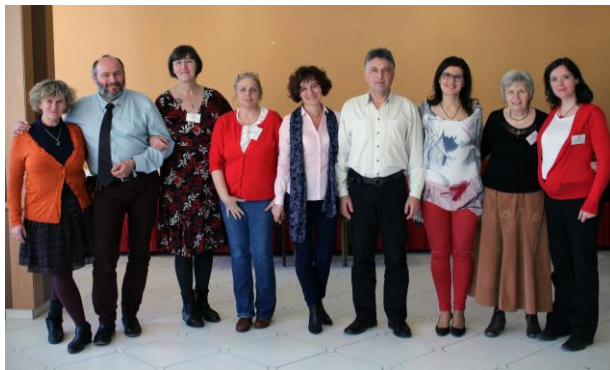
Das HSPPPM Board Team

Das gesamte Programm und einige Abstracts sind in englischer Sprache verfügbar unter: http://mpppot.hu/homepage/index.php/eng-2017-congress-abstracts