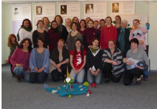
Netzwerktreffen in Kassel

Elterninitiativen für eine Reform der Geburtskultur haben sich bundesweit zusammengeschlossen und eine Grundsatzerklärung formuliert, die die isppm e.V. unterstützt, indem sie zu den erstunterzeichnenden Vereinen gehört. Wir freuen uns über das enorme Echo, etwa 750 EinzelunterzeichnerInnen auf vier Seiten kleingedruckt zeigen, es bewegt sich etwas!