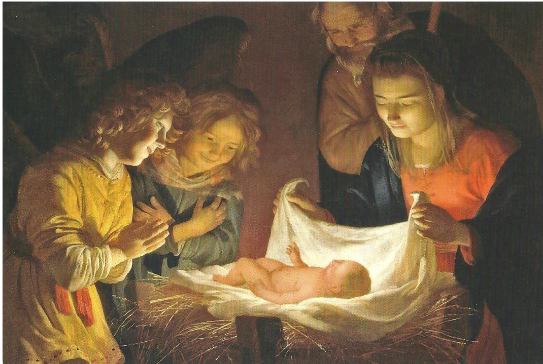
Gerrit van Honthorst, „Anbetung des Kindes“, um 1620